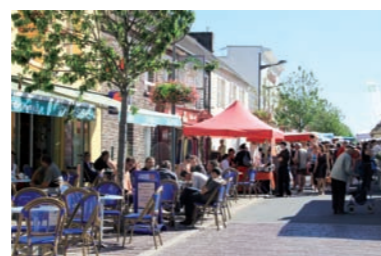
Jour de marché à Plélan