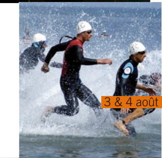
3 & 4 août

Tarifs:13€ (réduits 9€) http://portedescrets-broceliande.com