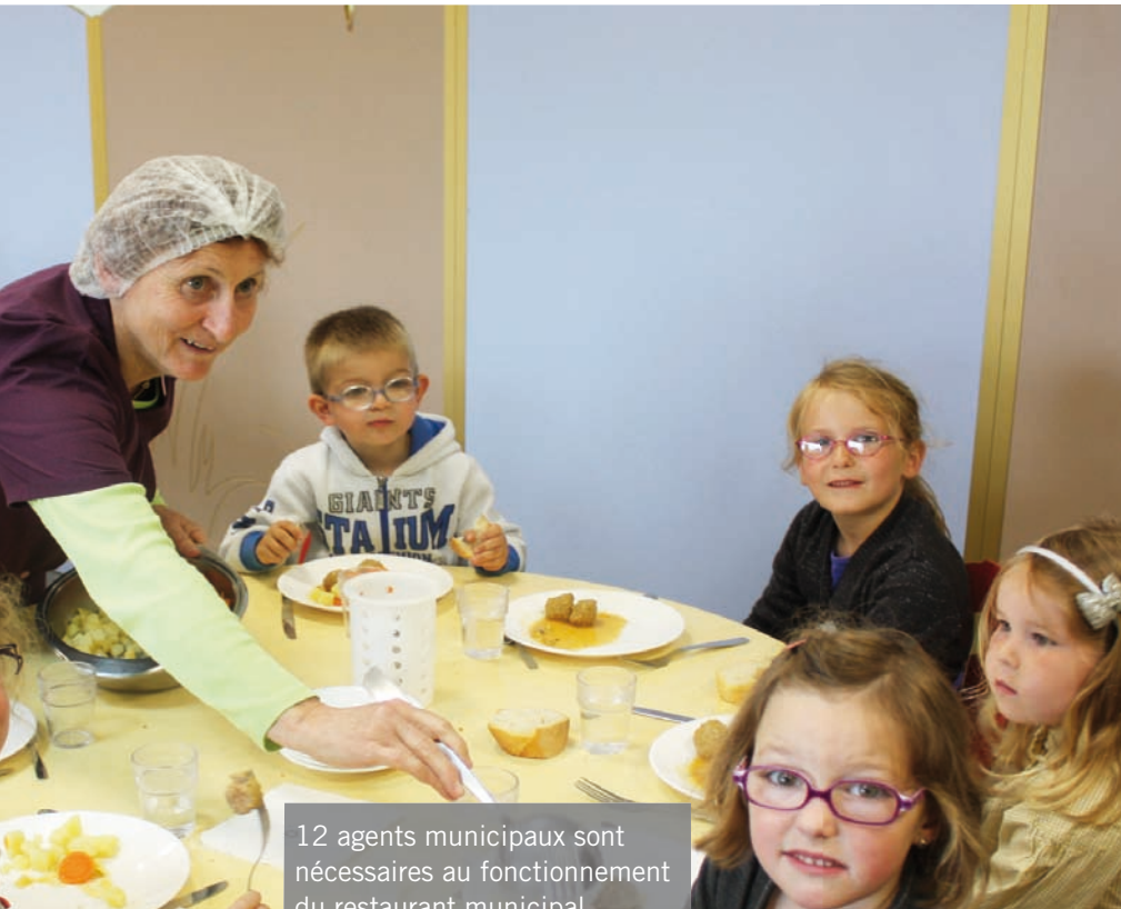
12 agents municipaux sont nécessaires au fonctionnement du restaurant municipal