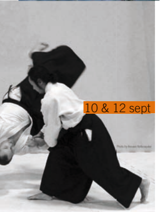
10 & 12 sept