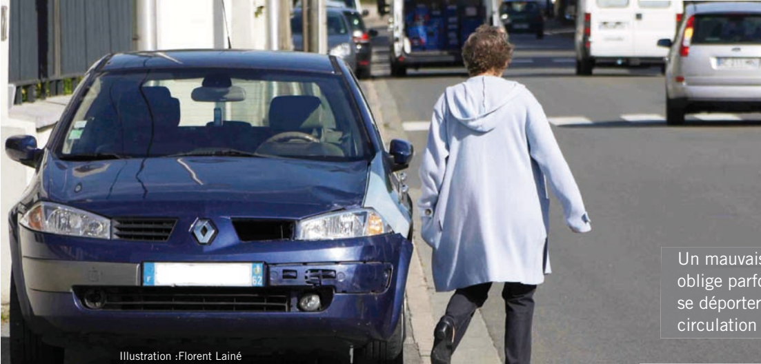
Illustration : Florent Lainé

Un mauvais stationnement oblige parfois un piéton à se déporter sur la voie de circulation