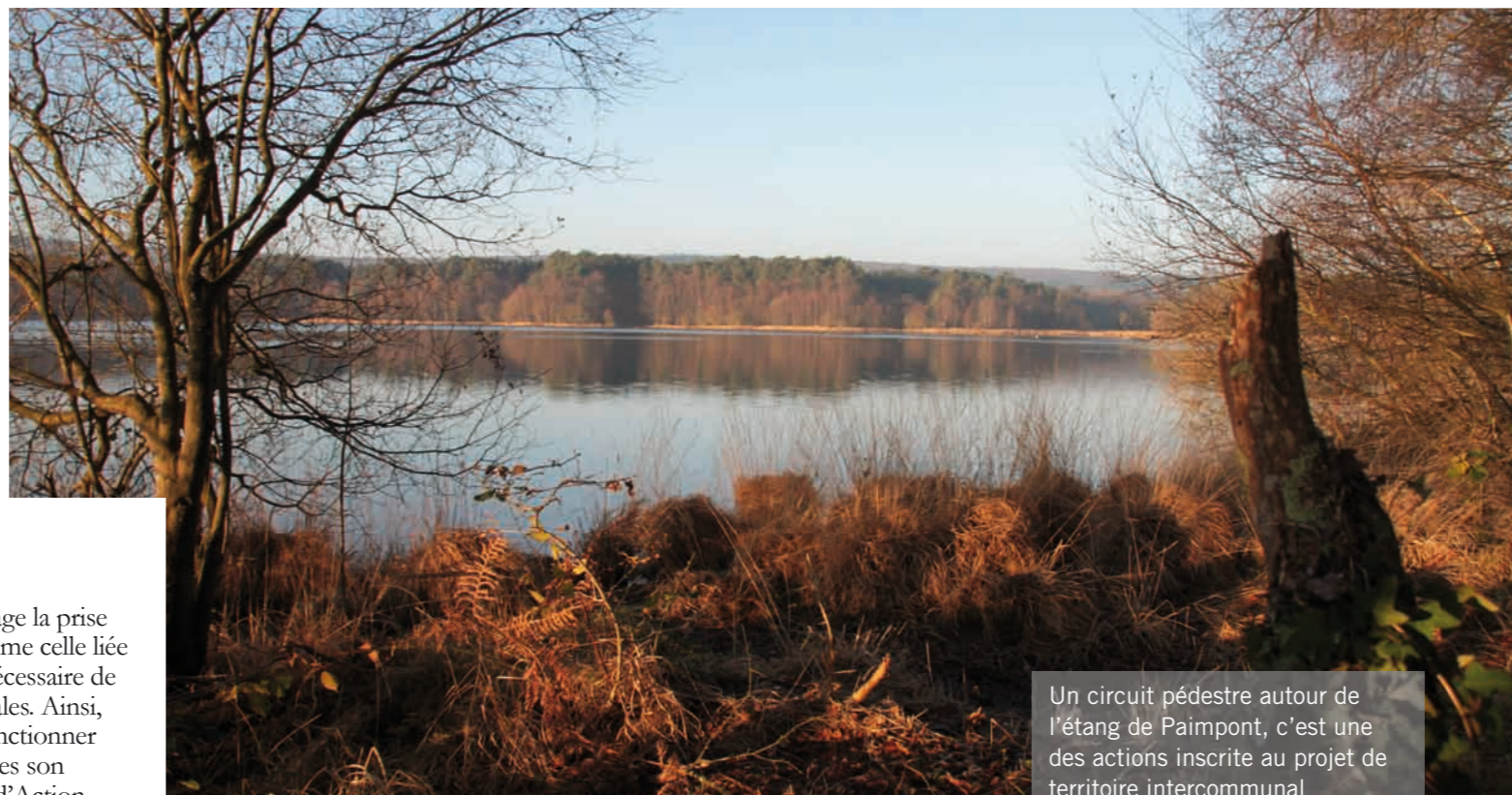
Un circuit pédestre autour de l'étang de Paimpont, c'est une des actions inscrite au projet de territoire intercommunal

La visée de l'intérêt communautaire n'est pas la seule règle qui s'impose à l'écriture de ce Projet de territoire. Il s'agit aussi de maîtriser les ratios d'endettement en fonction des priorités et de l'équilibre financier de la Communauté de Communes. De plus, les élus communautaires ont voté en 2006 le principe des fonds de concours remontants. Ce principe fixe la participation des communes bénéficiaires d'un projet à 10% des dépenses d'investissement. La solidarité communautaire a un prix, celui de la co-construction.