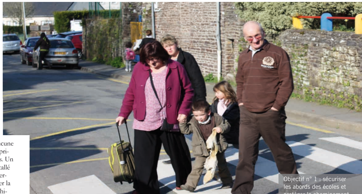
Objectif n° 1 : sécuriser les abords des écoles et protéger le cheminement des enfants.

*Suite à la loi sur l'égalité des droits et des chances, il est demandé aux collectivités d'établir un plan de mise en accessibilité de la voirie et des aménagements des espaces publics.