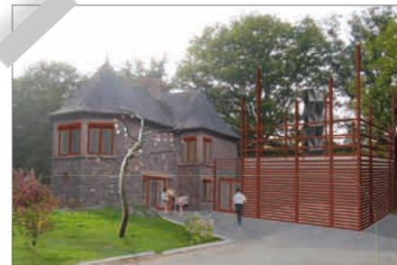
3 L'aparté à Iffendic

P rofitier d'une escapade à vélo pour marier culture et loisirs... c'est possible au Domaine de Trémelin ! Vous connaissez sans doute sa plage et son aire d'accrobranches, mais peut-être pas encore son espace dédié à l'art contemporain : l'Aperté. Cet été, c'est l'artiste Rémi Dal Negro qui investira le lieu avec une installation qui mêle l'esthétique baroque et l'art numérique. L'aperté. Domaine de Trémelin à Iffendic. 10kms de Plélan. Entrée libre et gratuite. Ouvert du mardi au samedi de 14h à 18h. Entrée libre et gratuite.