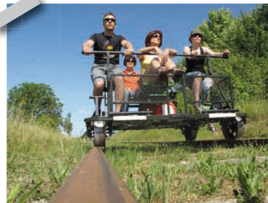
2 Vélo-rail à Médréac