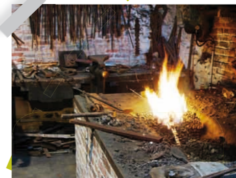
4 Musée de la forge à St Gonlay

E mprunter l'ancienne voie de chemin de fer qui reliait la Brohinière à Dinan à bord d'un vélo-rail. C'est l'occasion de découvrir la vallée du Néel et la forêt de Montauban et pourquoi pas de pique-niquer au pied d'une chapelle classée du XV ème siècle ? Deux parcours sont possibles : 6 ou 14 kms et même des excursions nocturnes tous les jeudis de 18h30 à 22h. Pour les personnes en difficulté physique, cinq draisines motorisées permettent de profiter du même parcours. Ouvert tous les jours pendant l'été de 10h à 18h. Pays de Montauban : 02 99 07 30 48