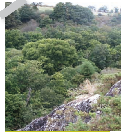
1 Rocher de Ruminy