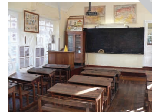
5 Ecole de St Gonlay

P rofitier d'une escapade à vélo pour marier culture et loisirs... c'est possible au Domaine de Trémelin ! Vous connaissez sans doute sa plage et son aire d'accrobranches, mais peut-être pas encore son espace dédié à l'art contemporain : l'Aperté. Cet été, c'est l'artiste Rémi Dal Negro qui investira le lieu avec une installation qui mêle l'esthétique baroque et l'art numérique. L'aperté. Domaine de Trémelin à Iffendic. 10kms de Plélan. Entrée libre et gratuite. Ouvert du mardi au samedi de 14h à 18h. Entrée libre et gratuite.