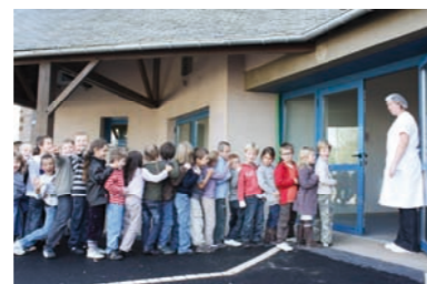
Des élèves de l'école la "Pierre Pourprée" devant le restaurant municipal